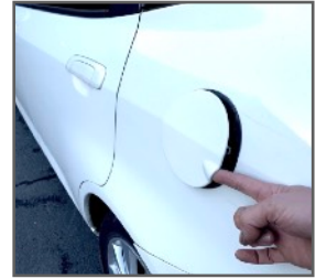
白のFitをご利用の場合は給油口の蓋を直接手で開ける